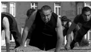
"The Cost of Living", DV8 Miércoles 10, 18:00 hrs.

Dança em foco - Festival Internacional de Vídeo & Dança es un evento realizado en Río de Janeiro orientado al desarrollo conjunto los lenguajes de la danza, el cine y el video. Creado en el año 2003 como primer evento brasilero enteramente dedicado a la interface video/danza. Dança em foco , junto al Festival Internacional de Videodanza del Uruguay y el Festival Internacional de Videodanza de Buenos Aires, forma el Circuito de Videodanza del Mercosur, CVM.